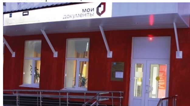
МФЦ ЗАТО г. Заозерск (открыт в январе 2016 года)

Нашим посетителям нравится и график работы учреждения, и комфортные условия, и возможность бесплатного доступа к федеральной государственной информационной системе «Единый портал государственных и муниципальных услуг». На портале заявители самостоятельно или с помощью наших сотрудников могут оформить заявление на получение загранпаспорта нового образца, узнать о штрафах ГИБДД, зарегистрировать автомобиль и многое другое. Жители довольны работой наших специалистов по консультированию о предоставлении государственных и муниципальных услуг как посредством телефонной связи, так и непосредственно при приеме заявителей в офисе МФЦ.