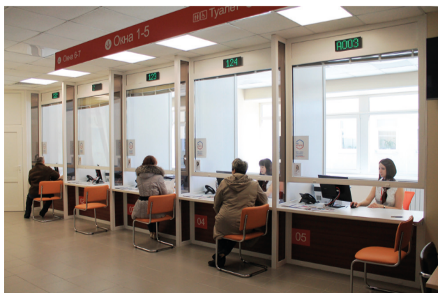
МФЦ г. Полярные Зори (открыт в январе 2016 года)

С целью повышения качества предоставления государственных и муниципальных услуг, реализации принципа экстерриториальности оказания услуг уполномоченным МФЦ на территории Мурманской области разработана и внедрена автоматизированная информационная система «МФЦ Мурманской области», которая успешно функционирует во всех МФЦ региона.