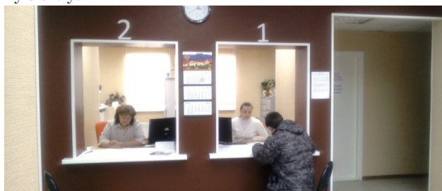
МФЦ в Терском районе (открыт в ноябре 2015 года)

С открытием в начале 2015 года многофункционального центра в городе Мончегорске предоставление государственных и муниципальных услуг для горожан стало максимально доступным и удобным. Отпала необходимость бегать по чиновничьим кабинетам и собирать справки, стоять в очередях, нервничать, доказывая свою правоту. Режим работы Центра нравится абсолютному большинству жителей, ведь теперь человек может сдать документы на предоставление услуги и получение результата в течение всего дня, даже в восемь утра или в восемь вечера, а также в субботу. Мончегорцы могут в комфортной, доброжелательной обстановке получить более 190 услуг, а также запросить необходимую для какой-то жизненной ситуации справку, выписку, одновременно оплатить госпошлину. В общем, принцип «одного окна», то есть получение сразу нескольких услуг, причем совершенно разных, заработал в полную силу!