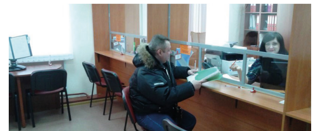
МФЦ ЗАТО Видяево (открыт в январе 2016 года)