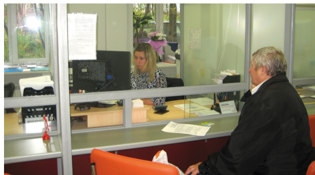
МФЦ г. Апатиты (открыт в марте 2015 года)

Сегодня я впервые воспользовалась услугами МФЦ и была приятно удивлена. Мне необходимо было получить услугу Пенсионного фонда. В 14.15 я подошла в офис МФЦ в г. Кола, получила талон и практически сразу меня пригласили в окно № 3. Девушка-специалист отнеслась ко мне очень доброжелательно, сделала необходимые копии документов, рассказала о сроках получения результата.